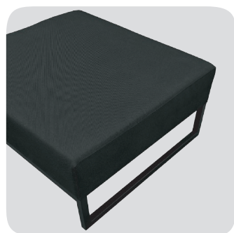
BASE TIPO ARCO

Mesa ratona con base de perfiles metálicos de 3x3 cm. Base y melamínico de tonos a elección.